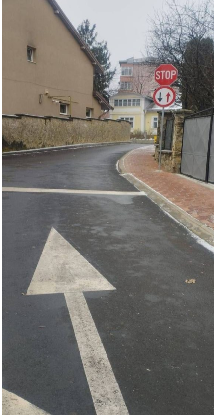
*str. Ion Luca Caragiale