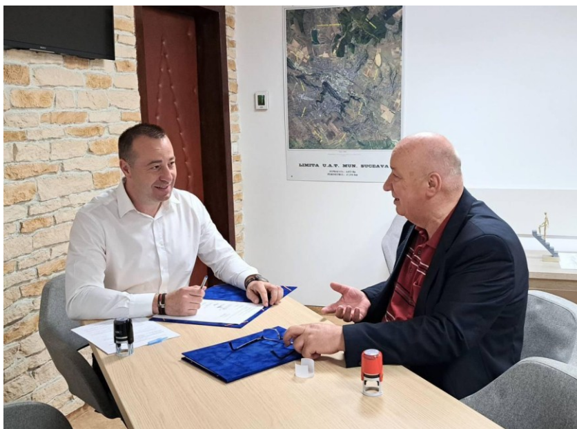
*Imagine de la semnarea contractului de finațare.