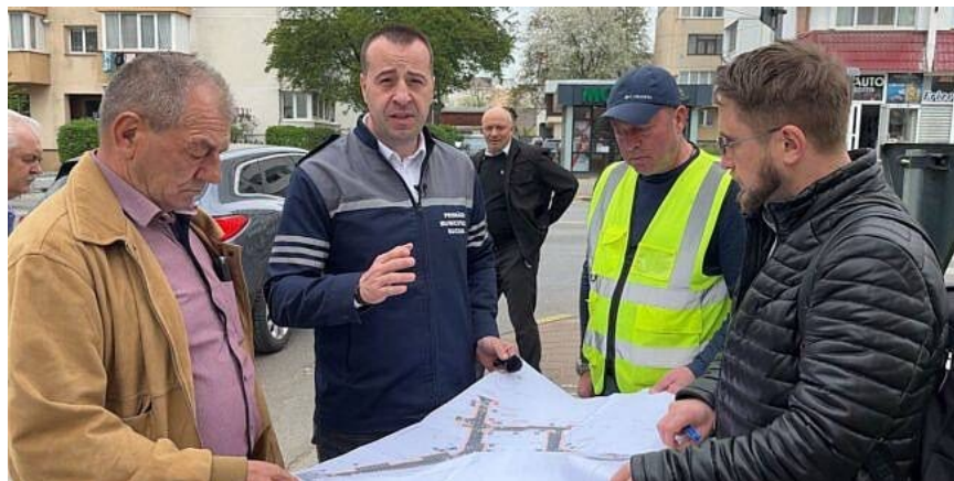
*Imagine de la demararea lucrărilor pe str. Păcii.