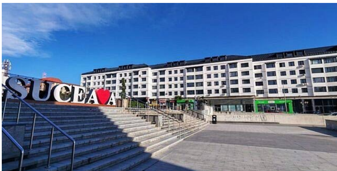
*Ușor, ușor vom avea o nouă înfățișare a Pieței 22 Decembrie.