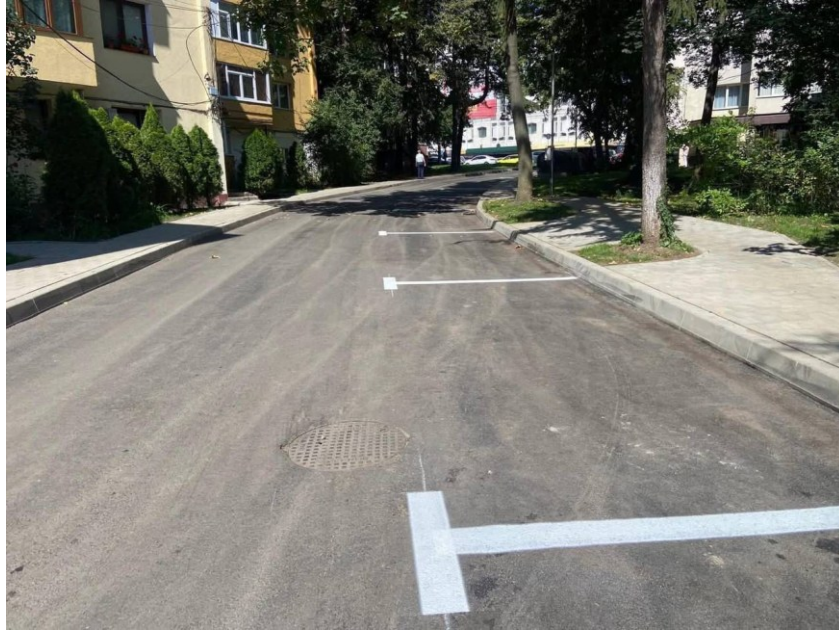
*str. Ștefan Dracinschi

Mai enumăr doar câteva dintre străzile pe care s-a lucrat: str. Ștefan Dracinschi, str. Maria Voichița, str. 6 Noiembrie, str. Ion Luca Caragiale din Ițcani, str. Oituz, str. Ștefan Tomșa, str. Stejarului. Lista completă se regăsește în raportul de activitate anterior.