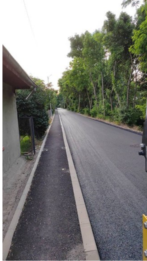
*str. 6 Noiembrie.