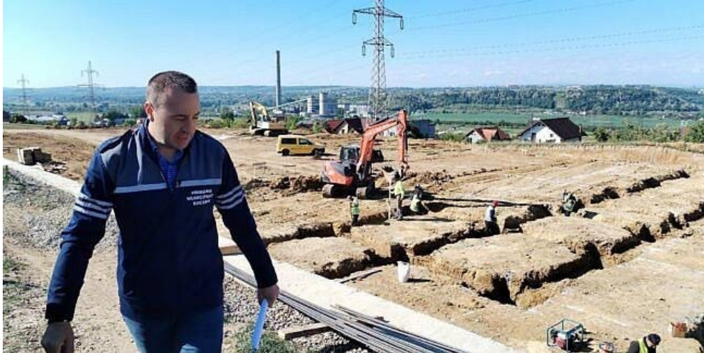
*Imagine de la demararea lucrărilor de construire a creșei.

https://www.monitorulsv.ro/cusnir-a-luat-foc-cand-harsovschi-a-intrebat-in-consiliul-local-despre-stadiul-de-executie-a-noilor-crese-si-despre-un-nou-stadion-in-suceava_dc8a3c/